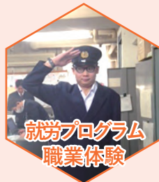
就労プログラム 職業体験