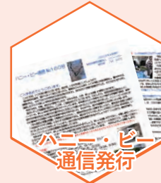
ハニー・ビー 通信発行